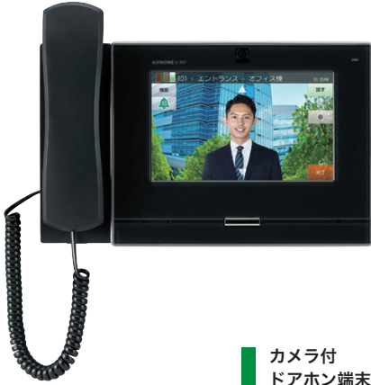
カメラ付 ドアホン端末 IX-EA